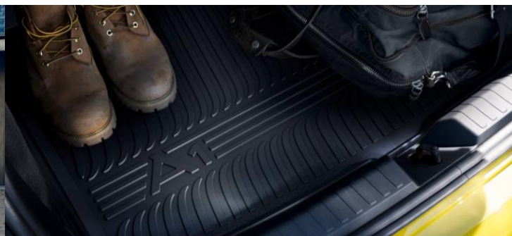
Pisos de goma y protección maletero