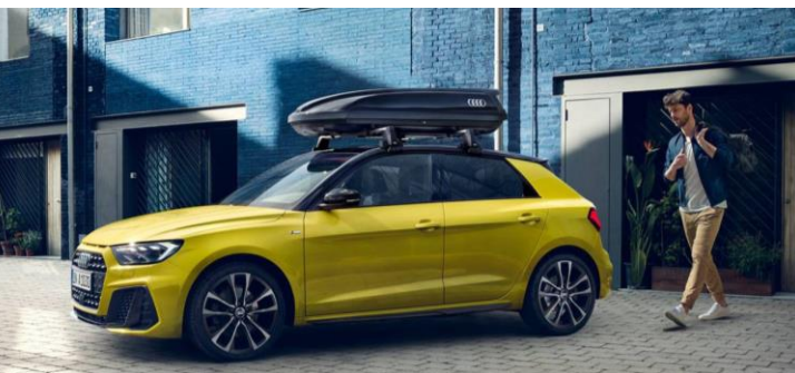
Barras de techo y Portaequipaje