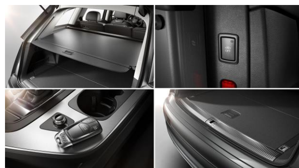
Llave de confort con desbloqueo del maletero por control gestual