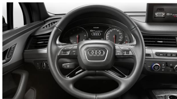
Volante multifunción en cuero, diseño 4 radios y levas de cambio