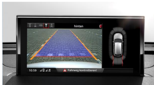
Sistema de aparcamiento plus delantero y trasero con cámara trasera