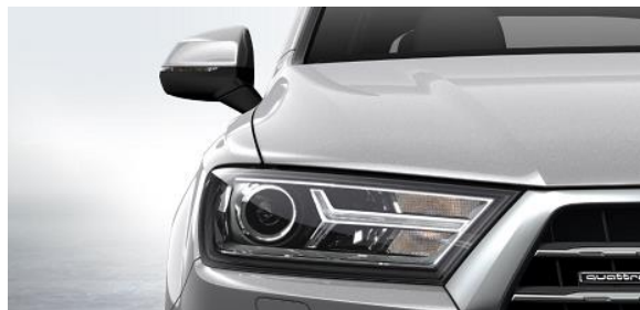
Luces de Xenón incl. luz LED de circulación diurna