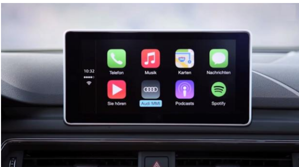
Audi Smartphone Interface