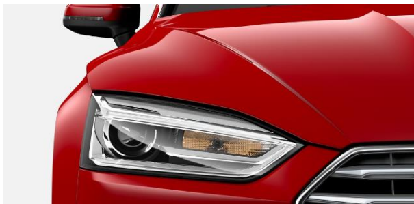
Faros principales Xenón Plus (Incl. High Beam)