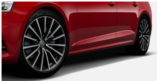
Llantas de aleación 19". Neumáticos 255 / 35 R 19. Incluye suspensión deportiva