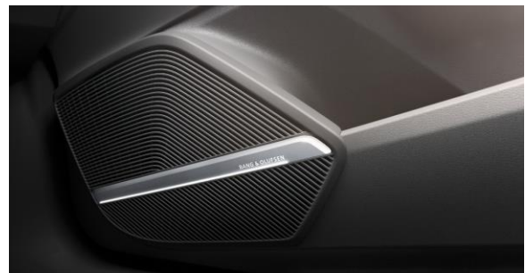
Sistema de Sonido Bang & Olufsen 3D