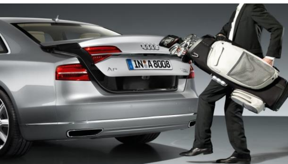
Keyless Entry con apertura del maletero con control gestual