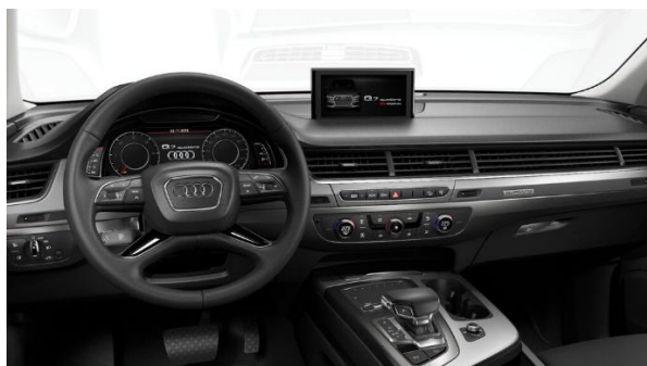
Volante multifunción en cuero, diseño 4 radios y levas de cambio