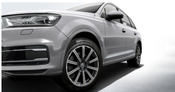
Llantas de aleación de aluminio tamaño 9Jx20, diseño estrella de 10 radios, con neumáticos 285/45