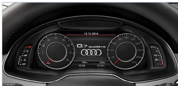
Audi Virtual Cockpit con MMI Navigation plus y panel touch

*Datos entregados por el 3CV. El rendimiento efectivamente obtenido por cada conductor dependerá de sus hábitos de conducción, de la frecuencia de mantenimiento del vehículo, de las condiciones ambientales y geográficas, entre otras.